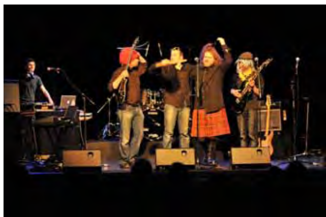
Jumpin' Freaks Band