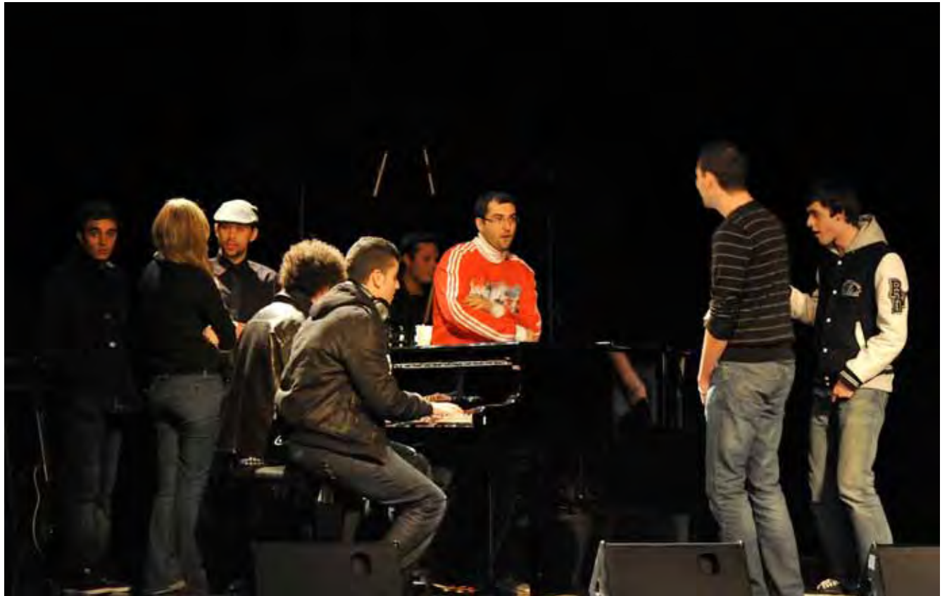
Moment de partage entre les groupes