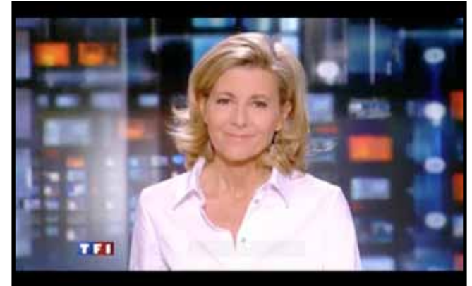
TF 1 Claire Chazal le journal de 20 H.