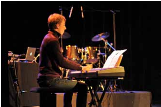
Jumpin' Freaks Band